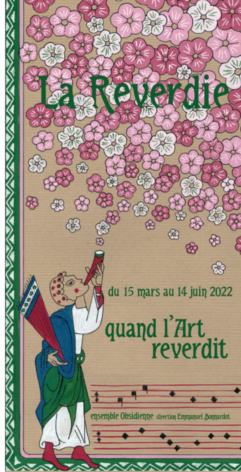
Illustration : Agnès Hardi Graphisme affiche : Marie Gourdon Graphisme dépliant : Lucas Boirat

créé en 2018 à l'occasion des « Fêtes de l'Âne, festival des Arts » à Sens et composé de chanteuses et chanteurs amateurs, se réunit ponctuellement, sous la direction d'Emmanuel Bonnardot, au gré de projets spécifiques. On retrouvera le chœur tout au long de cette REVERDIE 2022, le 9 avril au café Le Bourgogne de St-Valérien, le 21 mai aux côtés des chanteurs de l'École de Musique et Théâtre Yonne Nord pour le conte musical « L'Ogre de la forêt noire » et le 5 juin au cours de « l'après-midi au jardin de Miroslav » à Michery.